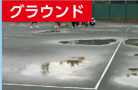
雨上がりのグラウンド整備に！