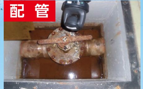
配管スペースの水の除去に！