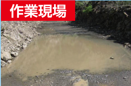
作業現場の水たまり除去に！